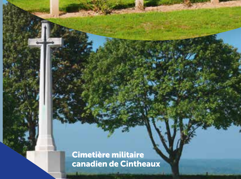
Cimetière militaire canadien de Cintheaux