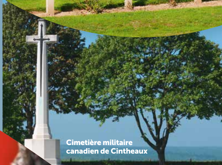
Cimetière militaire canadien de Cintheaux